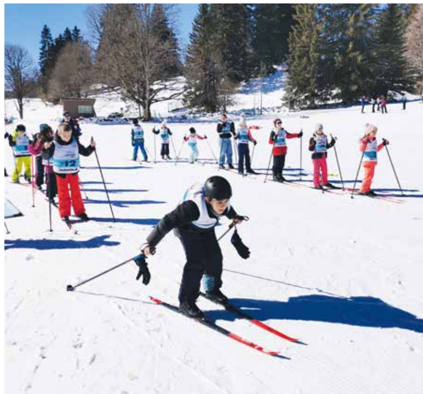
Plus de cinq cents enfants de Val-de-Ruz ont participé à la «Caravane Cologne».

de beau temps. Jérémy Huguenin relève encore qu'au mois de mars, 559 élèves de 31 classes de Val-de-Ruz ont participé à la «Caravane Cologne». Cette animation itinérante vise à initier les enfants au ski de fond par le prêt de matériel et l'encadrement des centres nor-