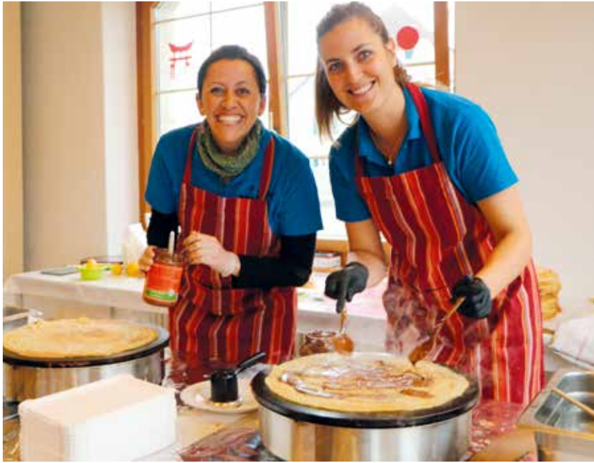
Les crêpières semblaient tenir la forme à Savagnier.

La Fête des crêpes voyage. Elle s'est arrêtée au Japon cette année. Plus précisément: le Pays du soleil levant constituait le thème d'une manifestation devenue traditionnelle, organisée à Savagnier par «Animation 2065», la société d'émulation du village.