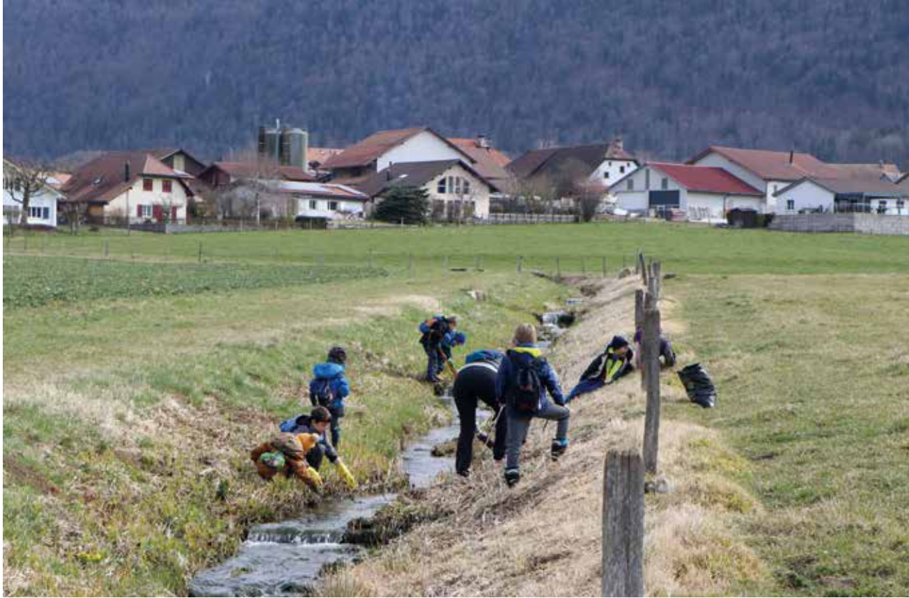
Au ruz de Savagnier, les élèves du village ont mis la main à la pâte.

Le début du printemps a coïncidé avec l'opération de nettoyage du Seyon. Un coup de balai annuel qui remonte à plus d'un quart de siècle. Une cinquantaine de bénévoles ont mis la main à la pâte sous l'impulsion de l'association SeyonVivant. Il y a encore trop de petits déchets.