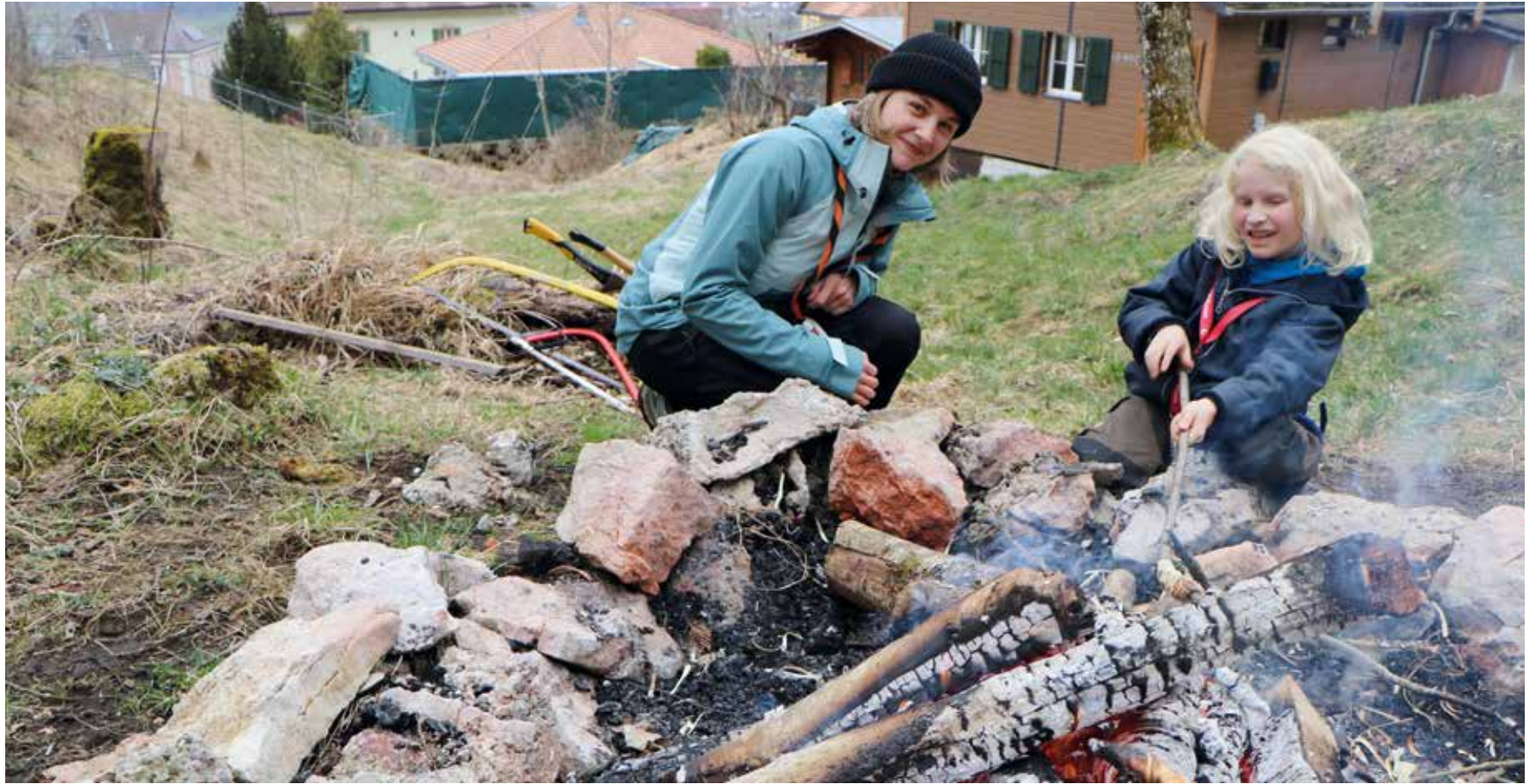
Pour le groupe Durandal à Cernier, l'occasion était bonne d'accueillir de nouveaux jeunes membres et de faire taire aussi quelques clichés à l'occasion de la journée nationale du scoutisme.