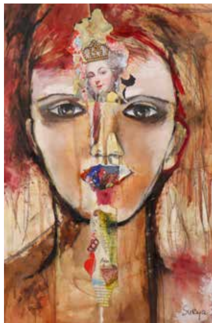
Il reste encore un week-end pour aller découvrir l'exposition de Surya à la Maison de Madame T (photo pif).

Le Groupe E se rapproche de la population du Val-de-Ruz. A la suite de la réalisation de son nouveau centre administratif à Malvilliers, l'entreprise fribourgeoise invite toutes les personnes intéressées à une journée portes ouvertes, samedi 5 avril dans l'après-midi. Cet événement permettra donc au grand public de découvrir les nouvelles infrastructures de l'entreprise. Des visites guidées et des activités seront également proposées.