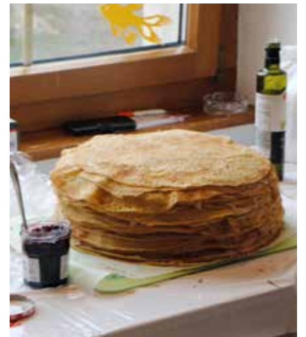
La pile de crêpes n'attendait qu'à être dévorée.

à la vitalité de Savagnier, une ancienne commune qui se caractérise par la densité de ses associations. Elle participera également à la renaissance de la fête du village, des 21 et 22 juin prochain, organisée sous l'impulsion de la société de jeunesse, forte aujourd'hui de 80 membres. Au sud du Val-de-Ruz, en face de la capitale, Savagnier, mal desservi par les transports publics, semble rester bien vivant. /pif