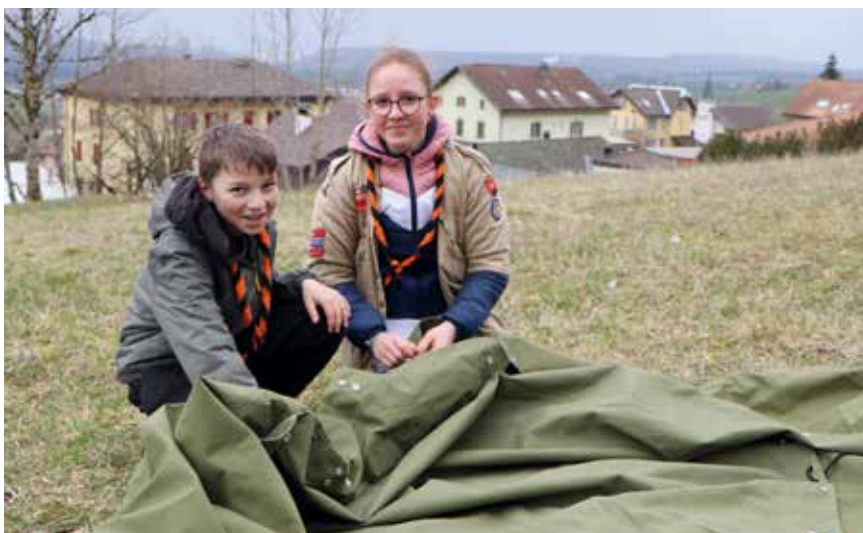
Pas facile de confectionner une tente avec des carrés militaires.

Découvrir le scoutisme, c'était l'objectif de la journée nationale, du samedi 15 mars, organisée dans toute la Suisse. Le groupe Durandal de Cernier était aussi de la partie. L'occasion était également bonne de gommer quelques clichés.